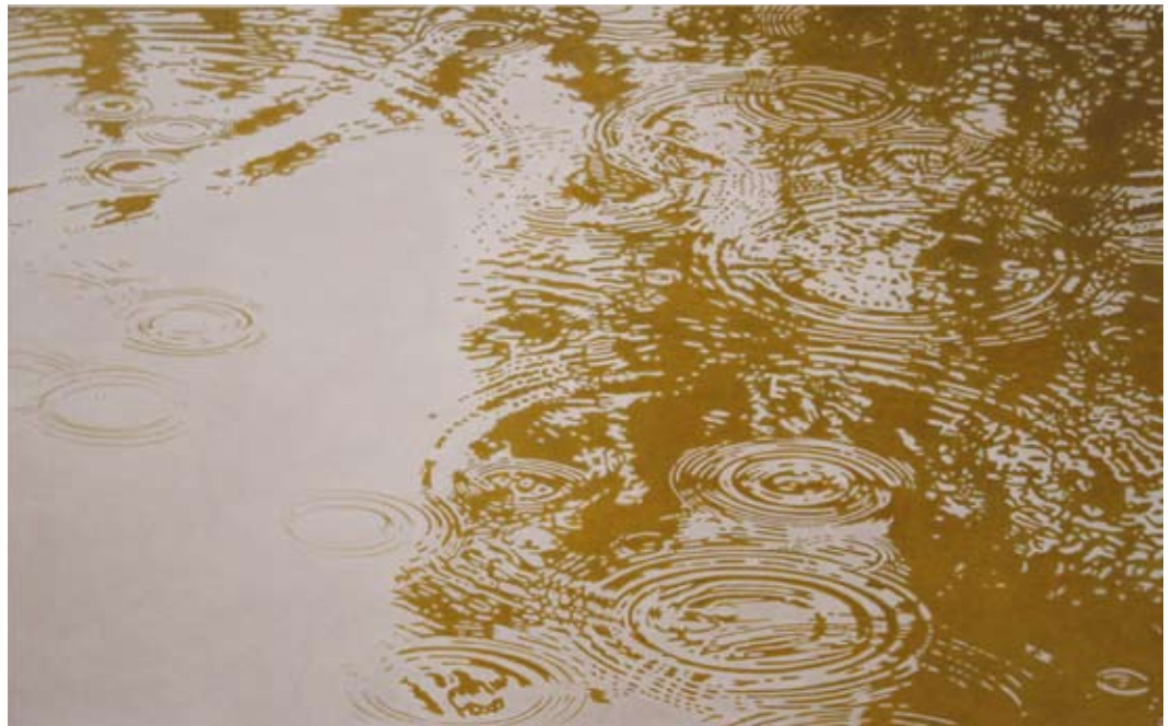
Anna Kiiskinen: „Oktober“ (2011), 100 x 160 cm; Acryl auf Leinen.

ihren Bildern, die sie für diese Ausstellung ausgesucht hat, zeigt. Ihre Wasserbilder sind im wahrsten Sinne des Wortes uferlos – die Bildausschnitte, die Kiiskinen wählt, lassen die Umgebung nur als vage Spiegelungen in den Bildraum hinein.